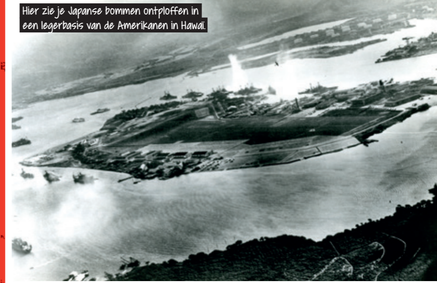
Hier zie je Japanse bommen ontploffen in een legerbasis van de Amerikanen in Hawaï.

De Amerikanen probeerden ervoor te zorgen dat Japan geen olie en ijzer kon kopen. Japan was daar boos over. Ze hadden die spullen nodig om oorlog te kunnen voeren. De Verenigde Staten hadden veel militairen in Azië, met een grote marinebasis op Hawaï: Pearl Harbor. Op 7 december 1941 viel Japan die marinebasis aan. Het was een complete verrassing. Japanees vliegtuigen lieten een regen van bommen vallen op Pearl Harbor. Ze vernielden meer dan 200 Amerikaanse vliegtuigen, beschadigden vele schepen en doodden ruim 2400 Amerikanen.