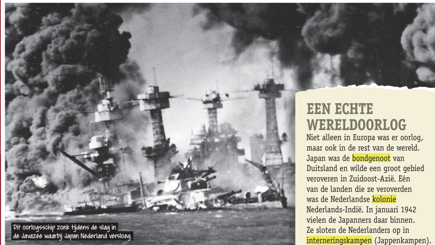
Dit oorlogsschip zank tijdens de slag in de Javazee waarbij Japan Nederland versloeg.