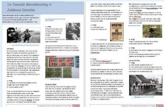
De SLO-Drenthe lesbrief.

Zodat op deze manier ook de jonge generatie meer bekend te maken met dit thema.